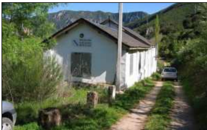
Refuxio de Cobas